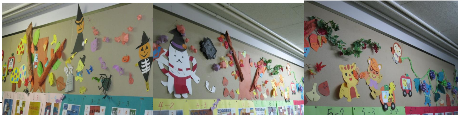
がっこうとしょかんまえろうか けいじ ぜんちょう メートル としよ まいつき きせつ あ さくせい りきさく 学校図書館前廊下の掲示(全長9 m ?)…図書ボランティアさんが毎月、季節に合わせて作成されています。力作です!