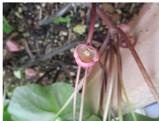
フラワー委員会が育てた フタバ アオイ